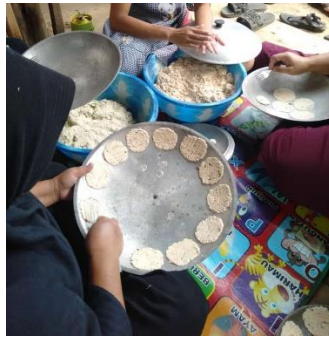
Figure 1. Proses pembuatan Kicha oleh anggota kelompok Kalintem Sabeungkeutan di Emplasemen Giriwangi.

Kegiatan pertama yang dilakukan kelompok Kalintem Sabeungkeutan dalam berpartisipasi pada ekoeduwisata di Perkebunan Teh Gambung adalah kreasi olahan makanan lokal. Tujuan kegiatan ini adalah memperkenalkan kekayaan kuliner lokal kepada wisatawan dan pengunjung. Produk makanan yang dipilih merupakan jenis pangan yang sudah akrab bagi masyarakat, baik dari segi rasa maupun teknik pengolahan. Salah satu contohnya adalah kicimpring, makanan ringan berbahan dasar singkong yang telah lama dikenal masyarakat setempat. Pemilihan produk berbasis umbi-umbian seperti singkong didasarkan pada kedekatan masyarakat yang sudah familiar dengan bahan baku tersebut, yang umum diolah dalam berbagai jenis makanan. Pada temuan Dara Senjawati et al. (2022) menegaskan bahwa pelatihan dan pendampingan kelompok wanita tani dapat meningkatkan nilai tambah komoditas lokal, dari sekadar konsumsi rumah tangga menjadi produk berdaya saing yang memperkuat ekonomi desa.