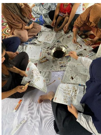
Figure 5. Praktek Mencanting

Kegiatan selanjutnya kelompok Kalintem Sabeungkeutan juga mengembangkan keterampilan membatik sebagai salah satu strategi pemberdayaan. Batik dipilih karena memiliki nilai ekonomi sekaligus nilai budaya yang tinggi, sehingga berpotensi menjadi produk unggulan dalam mendukung kegiatan ekowisata. Kegiatan ini terlaksana melalui kolaborasi dengan pihak swasta yang membantu memberikan pendampingan teknis kepada para anggota kelompok. Dalam proses pembelajaran, ibu-ibu anggota Kalintem dikenalkan pada tahapan dasar membatik, mulai dari membuat pola, mencanting, hingga teknik pewarnaan. Pendampingan dilakukan secara bertahap agar anggota kelompok dapat menguasai keterampilan dasar sekaligus memahami filosofi di balik motif batik.