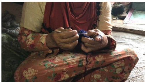
Figure 3. Proses pembuatan kerajinan rajut oleh anggota kelompok Kalintem Sabeungkeutan

Kegiatan kedua yang dilakukan kelompok Kalintem Sabeungkeutan adalah produksi kreasi kerajinan rajut. Inisiatif ini muncul dari pengakuan terhadap potensi keterampilan merajut yang dimiliki oleh beberapa perempuan di kelompok. Dua orang anggota yang sudah mahir dalam merajut berperan sebagai mentor, mengadakan pelatihan informal dan berbagi teknik dasar hingga lanjutan kepada anggota lain yang berminat. Produk-produk yang dihasilkan berupa taplak meja, tas, dan tempat tumbler. Ciri khas utama produk ini adalah pemilihan warna dominan hijau untuk mencerminkan identitas perkebunan teh Gambung. Pemilihan warna hijau sebagai warna yang dominan dipakai dalam produk rajut tidak terlepas dari kedekatan perempuan Kalintem dengan lingkungan perkebunan teh yang telah lama menjadi bagian dari kehidupan sehari-hari mereka. Sebagian besar anggota Kalintem Sabeungkeutan merupakan warga yang telah mentap di Gambung dalam waktu yang lama dan memiliki pengalaman hidup yang lekat dengan lanskap perkebunan. Sehingga warna hijau tidak hanya merepresentasikan tanaman teh secara visual, tetapi keterikatan mereka dengan lingkungan tempat tinggalnya, dan memberikan kesan perkebunan teh pada konsumen.