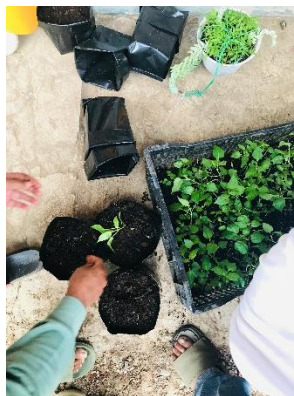
Figure 6. Pembagian Benih Tanaman

Secara estetika, pekarangan menjadi lebih asri dan sehat dengan adanya tanaman hijau, sementara secara ekonomis, hasil panen sederhana dari pekarangan dapat digunakan untuk kebutuhan rumah tangga atau dijual dalam skala kecil. Kegiatan ini sekaligus memperkenalkan aspek keberlanjutan dalam strategi pemberdayaan, karena perempuan didorong untuk berperan aktif dalam menjaga lingkungan sekaligus memanfaatkan potensi pekarangan.