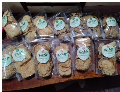
Figure 2. Produk Kicha (Kicimpring Matcha)

Makanan lokal yang dipilih untuk diproduksi adalah kicimpring, kicimpring merupakan olahan makanan yang terbuat dari singkong berbentuk kerupuk. Proses pembuatan Kicimpring dimulai dengan mengupas dan mencuci bersih singkong mentah, kemudian diparut hingga halus. Parutan singkong ini kemudian dibumbui dengan campuran sederhana seperti garam, bawang putih, dan ketumbar untuk memberikan cita rasa gurih. Setelah tercampur rata, adonan singkong dipipihkan tipis-tipis di atas loyang, lalu dijemur di bawah sinar matahari hingga benar-benar kering. Setelah melalui proses penjemuran, lembaran kicimpring yang telah kering digoreng hingga mengembang dan bertekstur renyah. Sebagai bentuk inovasi dan upaya meningkatkan nilai tambah pada produk, para perempuan Kalintem Sabeungkeutan melakukan berbagai percobaan dalam pengembangan produk kicimpring. Penambahan bubuk matcha dan potongan cabai merupakan hasil dari proses pencarian serta pengembangan resep yang mereka lakukan secara bertahap. Bagi mereka, penggunaan matcha memiliki makna khusus karena merefleksikan identitas Gambung sebagai wilayah perkebunan teh. Sementara variasi rasa pedas dari potongan cabai dihadirkan untuk menyesuaikan selera konsumen yang beragam.