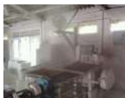
c. Fermentasi teh dengan pemberian uap air