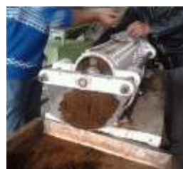
a. Penggilingan daun teh yang telah dilayukan dengan mesin rotorvane

Dari hasil tersebut terlihat bahwa penggunaan sediaan enzim serbuk yang kemudian dilarutkan tidak mampu meningkatkan mutu cita rasa teh CTC, sedangkan penggunaan sediaan enzim cair mampu meningkatkan mutu rasa teh. Oleh sebab itu, untuk percobaan selanjutnya digunakan sediaan enzim cair. Hasil percobaan menunjukkan bahwa penggunaan enzim pektinase cair mampu meningkatkan rasa dan aroma teh tetapi tampilan warna agak kurang. Meskipun peningkatan rasa dan aroma teh meningkat yang dapat meningkatkan premium harga, kondisi ini diperkirakan tidak mempengaruhi komposisi antargrade karena sistem klasifikasi grade ditentukan oleh banyak faktor.