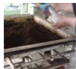
b. Aplikasi larutan enzim pektinase dengan penyemprotan