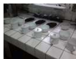
d. Uji citarasa teh yang dihasilkan dengan penambahan enzim pektinase cair, enzim pektinase padat yang dilarutkan, dan kontrol (tanpa enzim)